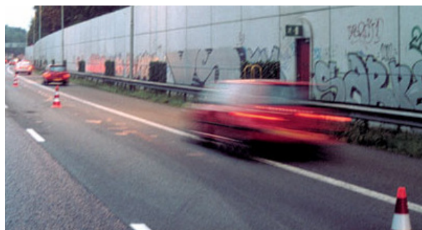
A12 aan Arnhemse zijde met het "reflectiescherm"

Voor de Stichting Duurzame A12 volop reden om door te gaan met onze strijd voor een leefbare omgeving en een duurzame ontwikkeling van de A12, ook al delen nog niet alle betrokken overheden van dit land onze visie.